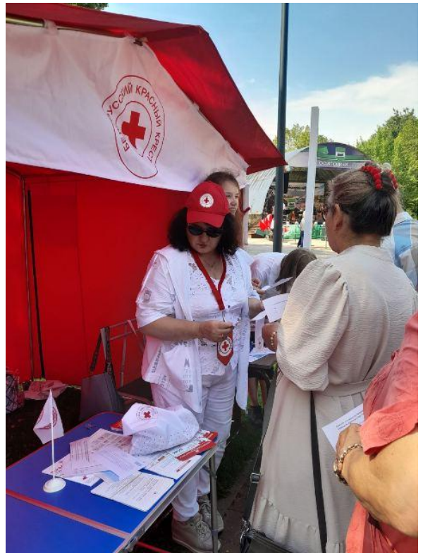
Мастер-класс по скандинавской ходьбе Белорусского общества Красного Крест Викторина «Что ты знаешь о Красном Кресте?»