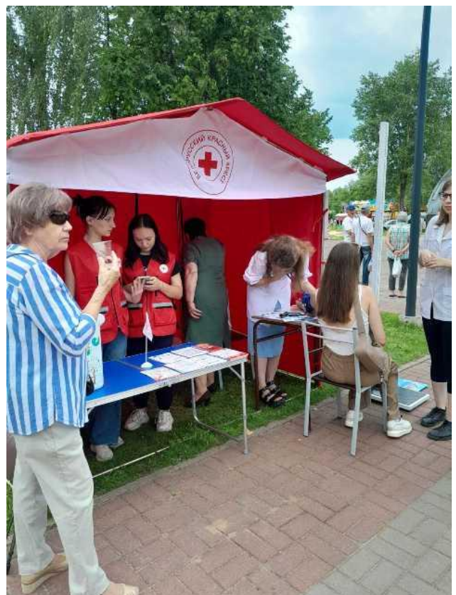
Выставка информационно-образовательного материала по профилактике неинфекционных заболеваний и раздачей информационно-образовательных материалов по здоровому образу жизни